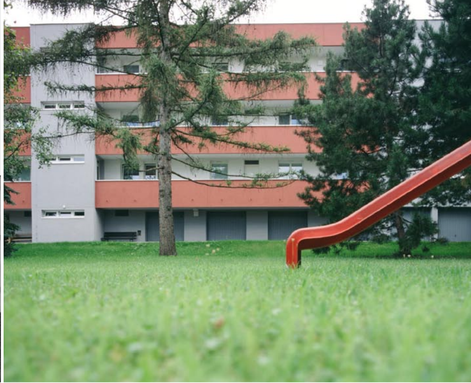
23., Ketzergasse 290 - 292