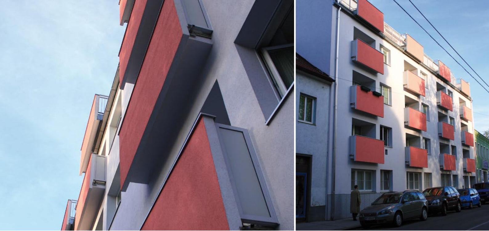
23., Perchtoldsdorferstraße 13