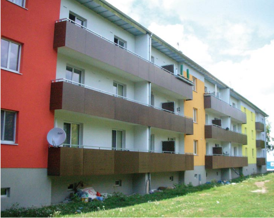
23., Schwemmingergasse 4