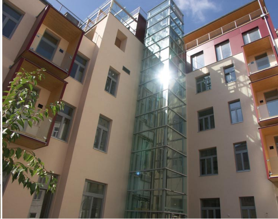
15., Selzergasse 34