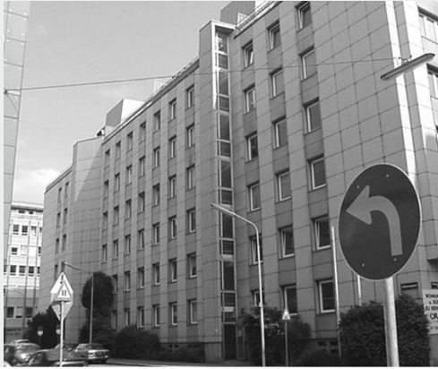
3., Bayerngasse 1-3