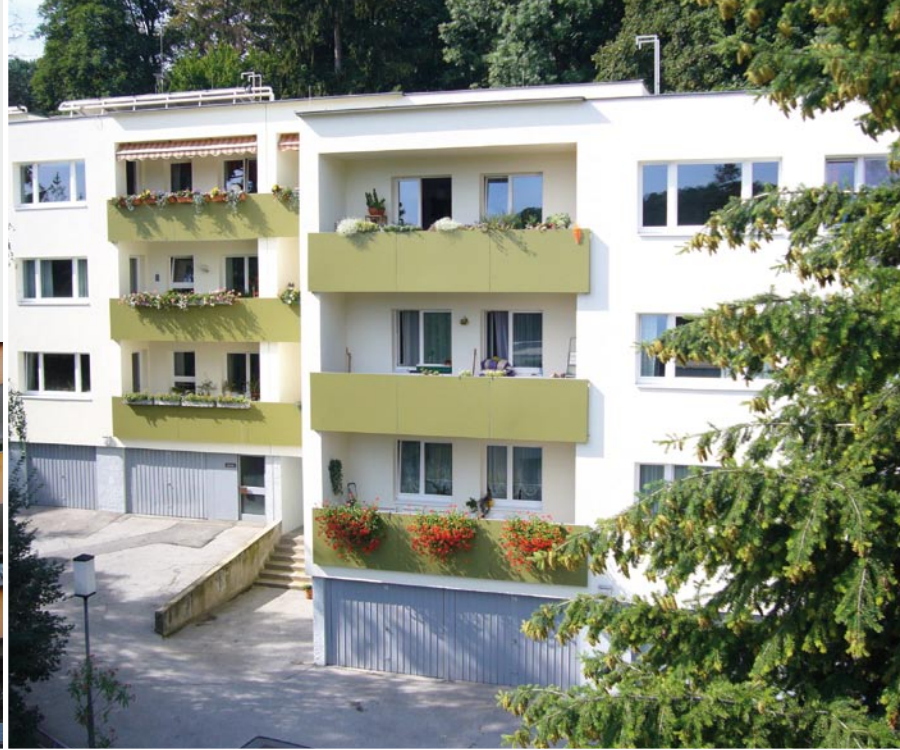
17., Promenadegasse 43