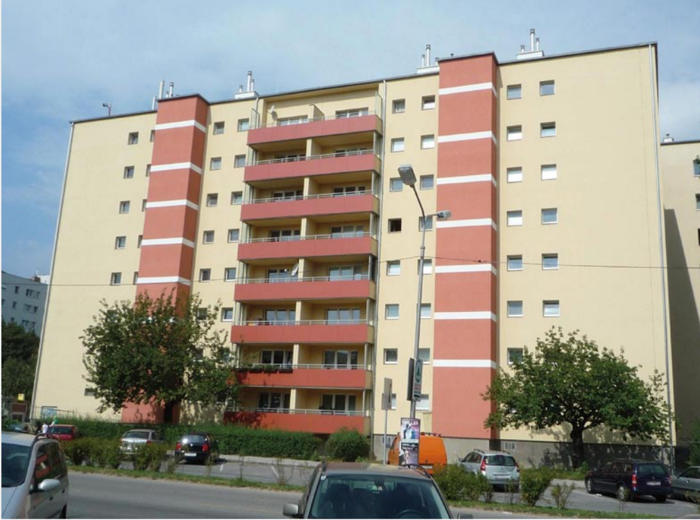
2., Dr. Natterer Gasse 2-4

Oberflächen von Wänden und Fußböden auch bei niedrigem Heizaufwand angenehm warm, der Einbau einer kontrollierten Wohnraumlüftung sorgt für ständig frische Luft.