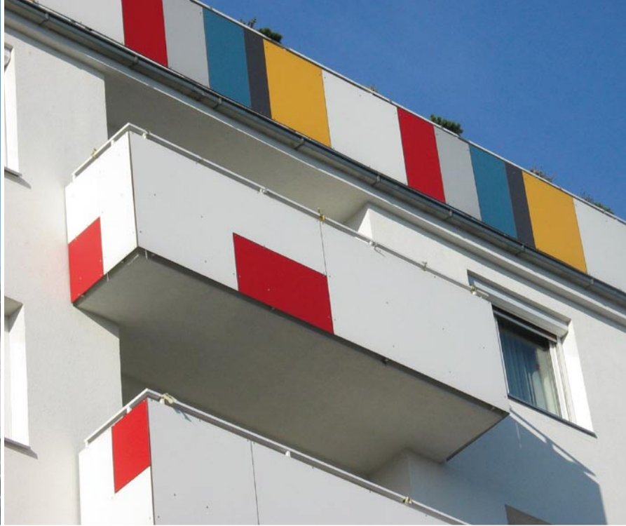
10., Sonnwendgasse 34