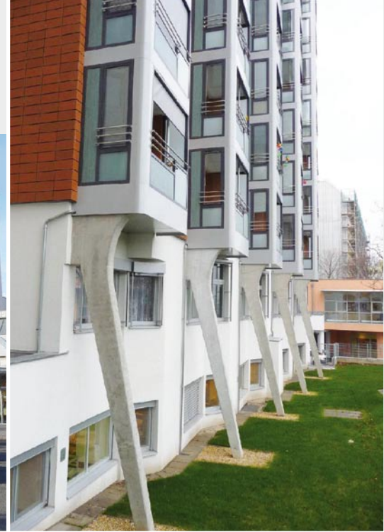
23., Gatterederstraße 12 (Wohnheim)

nichtzurückzahlbaren Zuschusses gewährt. Eine Kombination mit anderen attraktiven Förderungen, wie zum Beispiel für Dachgeschossausbauten, Zubauten sowie Maßnahmen zur Erhöhung des Wohnkomforts, ist möglich (Aufzüge, Balkone etc.).