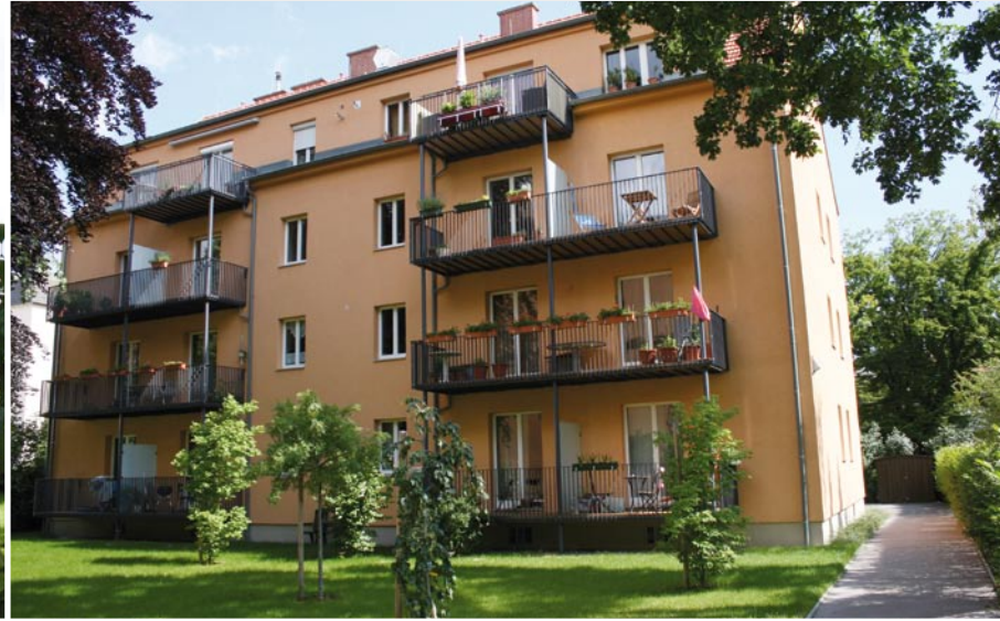
13., Hietzinger Hauptstraße 42d